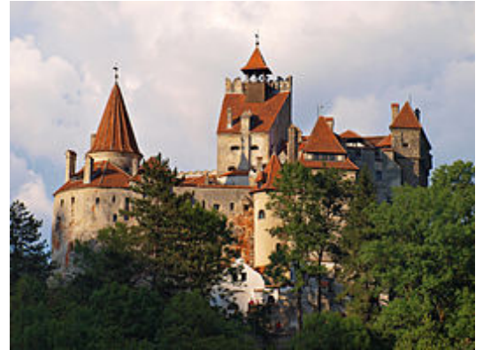
Kasteel Bran in de zomer

Kasteel Bran (Roemeens: Castelul Bran , Duits: Törzburg ) is een sprookjesachtig kasteel in de nabijheid van de Roemeense stad Bran, in de Zuidelijke Karpaten. De eerste bouw van het kasteel dateert uit de veertiende eeuw. Kasteel Bran , hooggelegen, met de typerende spitse rode torens, is een van de belangrijkste toeristische trekpleisters van Roemenië en staat bekend als het kasteel van Dracula , hoewel het geen connectie heeft met de historische noch met de fictieve figuur. [1]