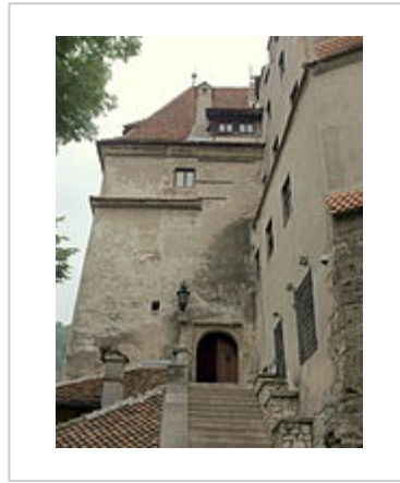
Trap naar zijingang