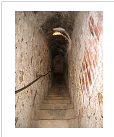
Geheime doorgang tussen de eerste en derde etage