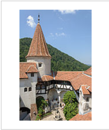
Gezicht op de binnenplaats