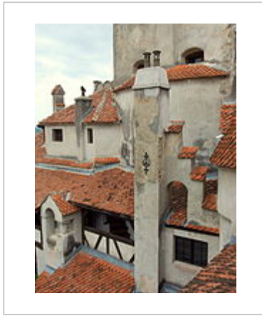
de Buitenzijde met daken en balkons