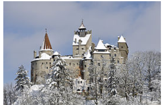
Kasteel Bran in de winter

"We liepen steeds verder omhoog... en opeens zag ik... een groot vervallen kasteel. Uit de zwarte ramen in de hoge spitse torens scheen geen licht en de verbrokkelde kantelenstaken als een rafelige rand af tegen het licht van de maan". Aldus beschreef Bram Stoker in 1897 het onderkomen van graaf Dracula, vampier en hoofdpersonage in zijn gelijknamige roman. Stoker heeft Kasteel Bran nooit bezocht en beschreef in feite een fictief Zevenburgskasteel . [5] Dat zijn beschrijving niettemin doet denken aan Kasteel Bran, heeft er waarschijnlijk mee te maken dat hij voor zijn roman gebruik maakte van vampierverhalen uit de Roemeense folklore, waarin Kasteel Bran en de omringende Karpaten veelvuldig werden beschreven. [6]