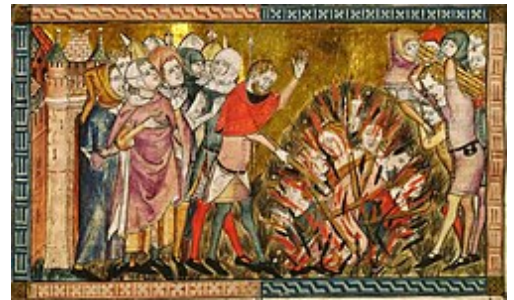
Jodenverbranding in Brabant tijdens de Zwarte Dood