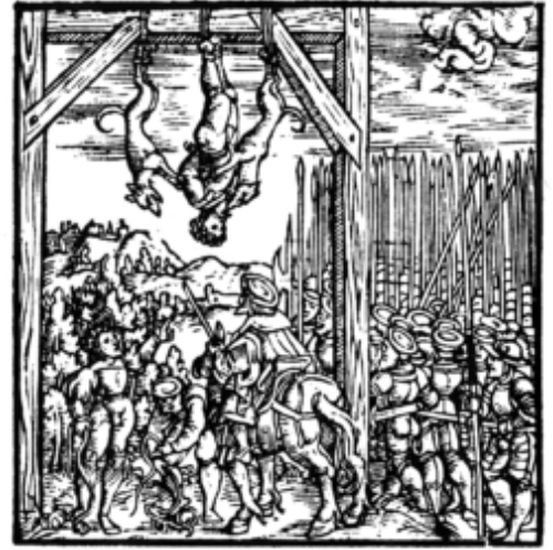
Een Jood werd op een bijzondere wijze opgehangen 15e eeuw

Later uitte Jodenhaat zich vooral als een sociaal verschijnsel en tegen het einde van de 19e eeuw ontstond er zelfs een zogenaamd biologische motivering. Wanneer reacties op Joden een overwegend religieus karakter hebben, wordt er gesproken van anti-judaïsme. Dit anti-judaïsme wordt door sommigen als niet-antisemitisch gezien, maar anderen zien het als dekmantel voor antisemitisme. [25] Slechts op het ogenblik dat vanuit het sociaal darwinisme Jodendom als een ras en niet langer als religie werd beschouwd, werd anti-judaïsme antisemitisme. [26] Het begrip antisemitisme werd door Marr voorgesteld in de context van een meer wetenschappelijke benaming voor het oudere Duitse woord Judenhass (Jodenhaat). Men moet deze "herbenoeming" niet interpreteren als een poging om het concept van Jodenhaat te elimineren of 'verbergen'. Anderzijds is juist het gebruik van deze nieuwere term nogal eens bekritiseerd omdat hierbij ook andere Semieten werden inbegrepen - maar dat is pas veel recenter.