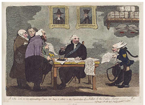
Op deze prent van James Gilray uit 1763 is een aantal antisemitische en antikatholieke vooroordelen samengebracht.