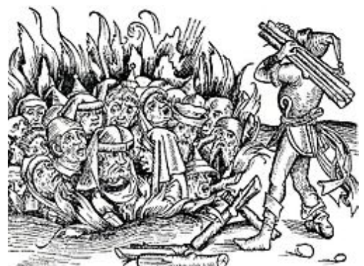
Joden worden verbrand als ketters, 15e eeuw