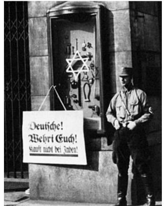
Duitsland 1933: 'Duitsers! Verdedig U! Koop niet bij Joden!'