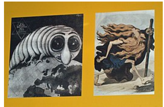
Duitse spotprenten vóór WO II

Duitse Arbeiderspartij ( NSDAP ) een massabeweging van. Hitlers antisemitisme en nationalisme week niet af van dat van Lanz of Schönerer, maar de manier waarop Hitler zijn boodschap 'aan de man bracht', namelijk via goed georganiseerde en voorbereide toespraken, maakte hem populair. Hitler begreep de mogelijkheden van de moderne massamedia zoals kranten , radio en film . Door een goed geoliede propagandamachine bewerkte hij de Duitse bevolking en werd populair. Van een minuscuul sektarisch clubje groeide de NSDAP snel uit tot een massapartij met afdelingen in Duitsland en Oostenrijk . Na de mislukte 'Bierkellerputsch' (ook Hitlerputsch) in 1923, werd Hitler tot een zeer korte gevangenisstraf veroordeeld (ter vergelijking: de hoofdmannen van de Beierse Revolutie van 1919 werden tot lange celstraffen veroordeeld of vermoord), die hij slechts gedeeltelijk uitzat. Hij gebruikte zijn gedwongen 'retraite' om zijn ideeën te formuleren in Mein Kampf , de latere 'bijbel' van het nationaalsocialisme . De NSDAP werd weliswaar verboden, maar dook spoedig weer op onder een nieuwe naam. Vanaf het einde van de jaren twintig (de NSDAP was toen weer de officiële naam) wonnen de nazi's steeds meer zetels in de Rijksdag en in 1933 werd Hitler door rijkspresident Paul von Hindenburg tot rijkskanselier benoemd.