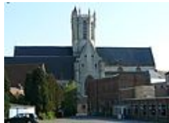
Scheldegotiek: Onze-Lieve-Vrouwekerk te Dendermonde