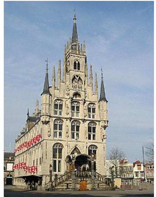
Stadhuis van Gouda