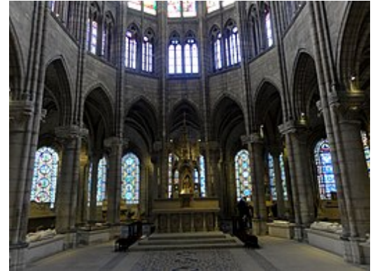
Saint-Denis, zicht op het koor gebouwd door abt Suger

De gotiek is de naam voor een laatmiddeleeuwse stijltoegepast in de periode 1140-1500 in de beeldende kunsten en de architectuur , die vooral aanwezig is in kerkgebouwen . Kenmerkend is onder andere het gebruik van spitsbogen bij raam- en deuropeningen en gewelven.