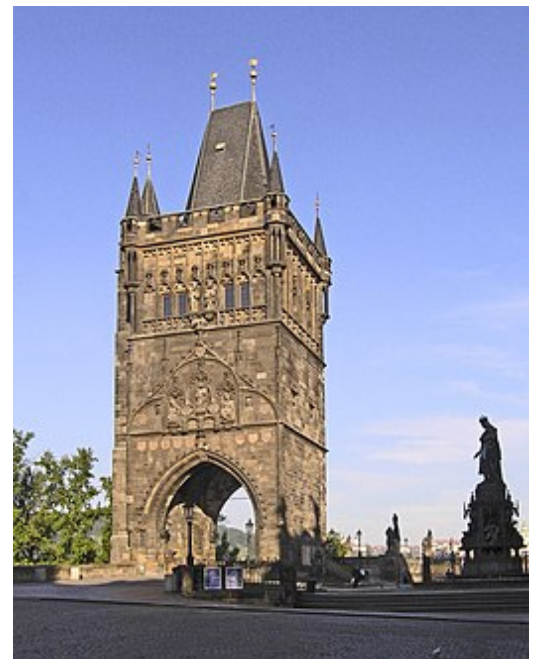
De laatgotische toren aan de oostzijde van de Karelsbrug in Praag