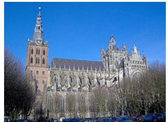
Sint-Jan te 's-Hertogenbosch Brabantse gotiek