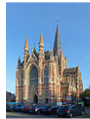
Neogotiek: de Onze-Lieve-Vrouwbasiliek in Dadizele