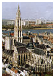
Flamboyante gotiek: Onze-Lieve-Vrouwekathedraal te Antwerpen