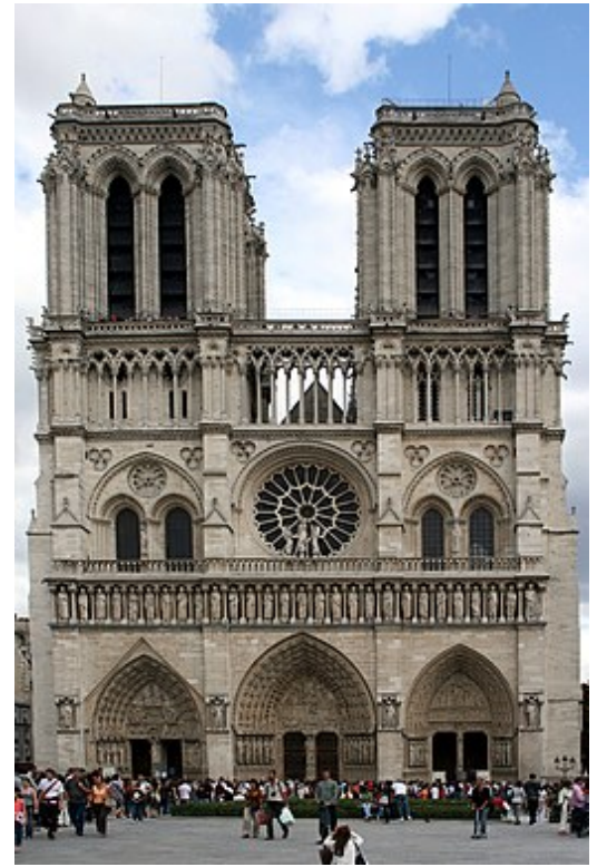
Notre-Dame van Parijs