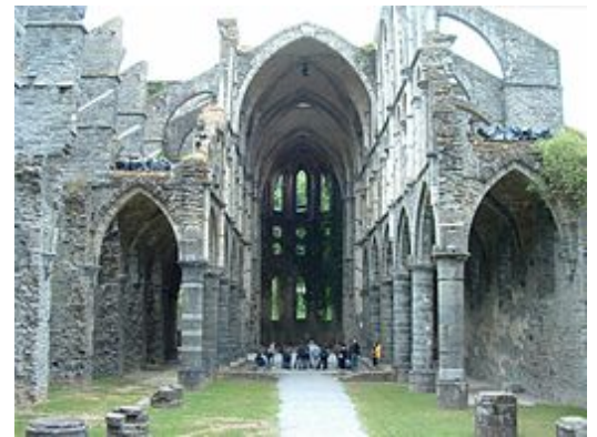
Doorsnede gotische kerk; Abdijkerk van Villers

Het veelvuldig gebruik van spitsbogen en hoge glasramenevenals de aanwezigheid van baldakijnen en roosvensters versterkten de verticaliteit. Door de grote hoogte van de kerken en kathedralen dienden de muren aan de buitenkant van het gebouw versterkt te worden met steunberen om de spatkrachten ten gevolge van de zware gemetselde gewelvente kunnen opvangen. Vooral in de Franse en Spaanse kerken werd de techniek van de luchtbogen gebruikt; deze bogen vormen de verbinding tussen de steunbeer en de buitenmuur. Het tongewelf en kruisgewelf werden vervangen door het kruisribgewelf waarbij de ribben de dragende elementen werden.