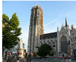
Brabantse gotiek: de St-Romboutskathedraal te Mechelen