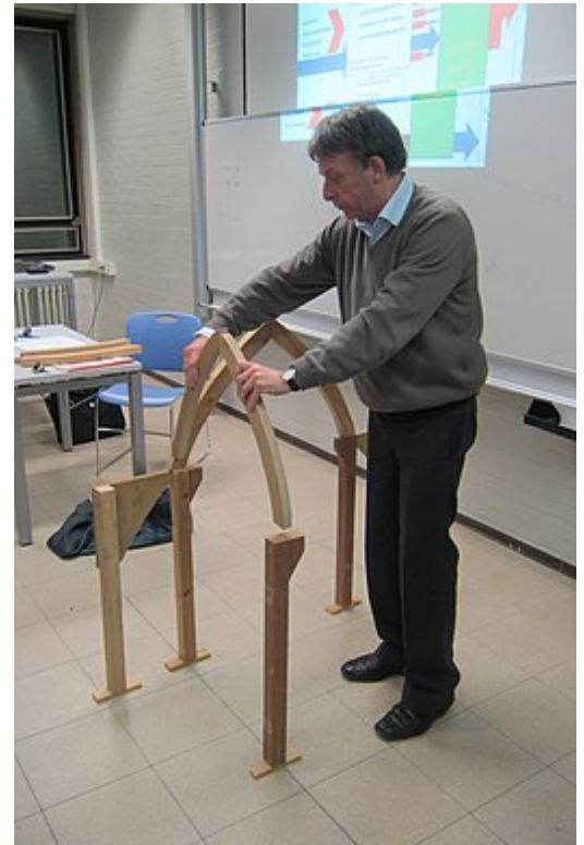
Constructieprincipe van een gotische kerk door dr. Jan Vaes

Het koor werd voorzien van een serie straalkapellen waarbij de tussenliggende muren konden worden weggelaten door de toepassing van kruisribgewelf , spitsboog en pilaren. Buitenwaartse krachten, die de neiging hebben de muren naar buiten te drukken, waren in de romaanse