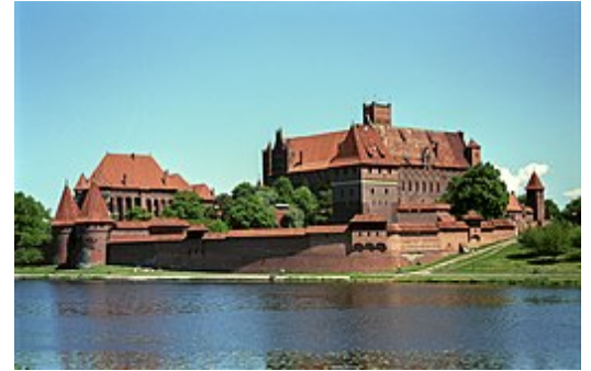
Het kasteel van de Duitse Orde te Malbork (Slot Mariënburg), Polen

Het woord 'gotiek' is afkomstig van het Germaanse volk de Goten , hoewel de gotiek daarmee niets te maken heeft. Pas in de 16e eeuw werd deze term door de intellectuelen gebruikt als spotnaam voor een bouwstijl die zij totaal smakeloos en barbaars vonden. De term voor de kunststroming die we nu gotiek noemen werd voor het eerst gebruikt door de Italiaanse architect Giorgio Vasari . Toen hij in opdracht van de hertog van Farnese in 1546 een overzicht maakte van alle bekende kunstenaars sinds de oudheid, gebruikte hij in zijn (zeer invloedrijke) boek deze naam voor alle laatmiddeleeuwse kunst waarin de hang naar verticaliteit terug te vinden is. De (renaissance)architect Vasari vond de stroming een primitieve Noord-Europese dwaling, die van de door de renaissancekunstenaars zo bewonderde Romeinse vormentaal afleidde. De naam is dus als scheldwoord bedoeld: de Goten golden in die tijd als de aanstichters van de val van het Romeinse Rijk.