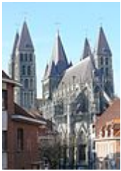
Vroege Scheldegotiek: Cathédrale Notre-Dame de Tournai (Doornik)