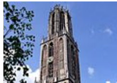
Utrechtse gotiek: Domtoren te Utrecht