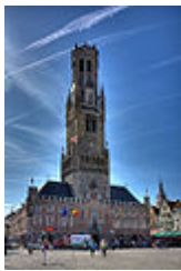
Het Brugse belfort