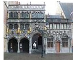
Brugge: de Heilig-Bloedbasiliek