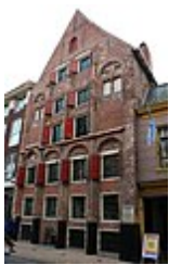
Gotisch Huis in Groningen (stad)