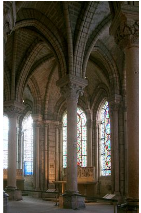
Kooromgang van de Kathedraal van Saint-Denis