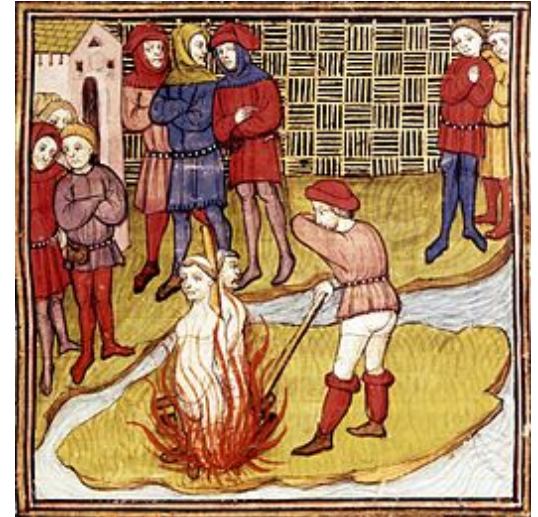
Grootmeester Jacques de Molay en commandeur Godfried van Charney op de brandstapel