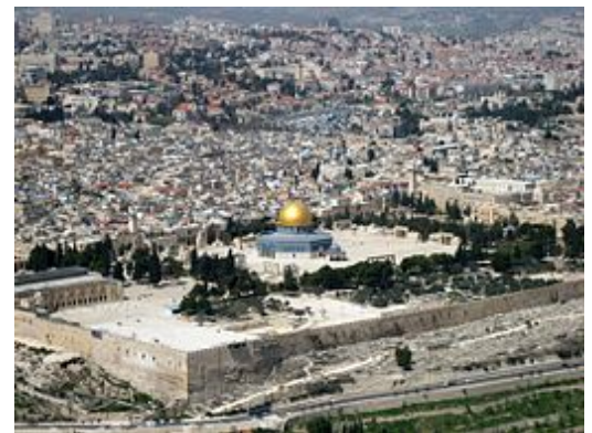
De Tempelberg, naamgever van de orde