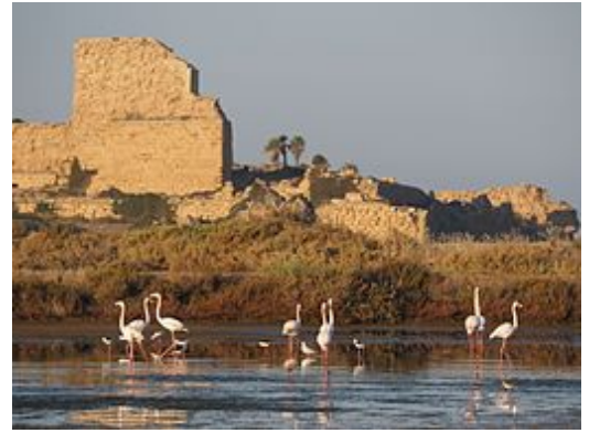
Atlit (Pelgrimsburcht), Israël

De voornaamste bron van inkomsten waren schenkingen. De tempelorde kreeg veel van koningen, graven, pausen, kardinalen, bisschoppen, landheren en eenvoudige lieden. Naast de boerderijen van de commanderijen ontving ze geld, kerken, kloosters, gastenverblijven, ziekenhuizen, huizen, tuinen, markten, molens, smidsen, et cetera. Al die goederen brachten winsten voort, vaak dankzij de arbeid van de horigen die verplicht waren om zonder beloning voor de landbezitter (de orde) te werken. De opbrengsten werden regelmatig aan het hoofdkwartier afgestaan. De Tempeliers bezaten ook vele parochiekerken die geld opleverden via missen en collecten.