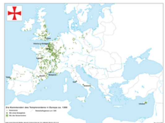
Bezittingen in Europa omstreeks 1300 (klik voor vergroting)

De commanderijen van de Tempeliers waren herenboerderijen die bestonden uit hoeven, schuren, akkers, weilanden, wijngaarden, kapellen en de daarbij behorende horige landarbeiders. Ze moesten de toevloed verzekeren van manschappen, geld, eten, paarden, wapens en bouwmaterialen. De commanderijen huisvestten ongeveer vier leden die tientallen landarbeiders commandeerden. Er waren meestal geen ridders aanwezig. De Tempeliers exploiteerden ruim 1.000 commanderijen in de landen van overzee, waarvan minstens 800 in Frankrijk. Engeland telde er 40, Duitsland 36. Ze waren gelegen langs de Europese pelgrimsroutes en in de havensteden naar het Heilige Land. De commanderijen van Londen, Parijs en La Rochelle werden uitgebouwd tot vestigingen.