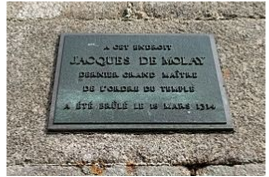
Gedenksteen Jacques de Molay in Parijs

De laatste grootmeester van de Tempeliers was Jacques de Molay , hij stierf op 18 maart 1314 in Parijs op de brandstapel. De Molay heeft gedurende zijn (schijn)proces onder marteling bekentenissen afgelegd, maar die later herroepen. De beschuldigingen tegen de Orde van ketterij, homoseksualiteit en aanbidding van "Baphomet" waren voor die tijd ongehoord. Het verhaal wil dat De Molay op de brandstapel de koning en de paus vervloekte; beiden stierven nog geen jaar later.