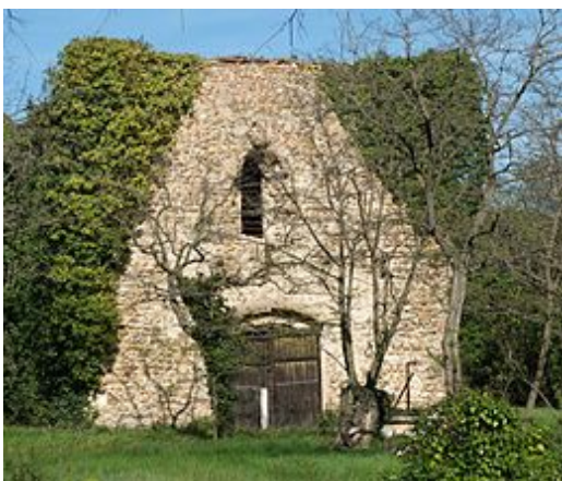
Kapel van de commanderie van Mas Deu, in 1138 door de tempeliers gebouwd, Trouillas , Roussillon , Frankrijk

De tempelorde was een internationale organisatie die haar manschappen en middelen haalde uit alle delen van West-Europa. Toch waren de Fransen toonaangevend binnen de orde. De bakermat van de Tempeliers lag in de Champagne ; de orde was van meet af aan populair in Frankrijk en het grootste deel van de grootmeesters, leden en commanderijen was Frans. Door schenkingen van de