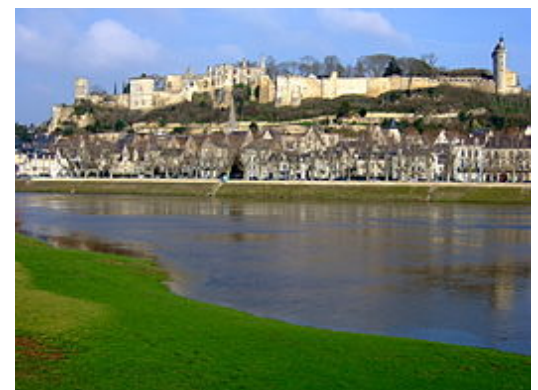
In het kasteel van Chinon werden belangrijke verhoren gehouden