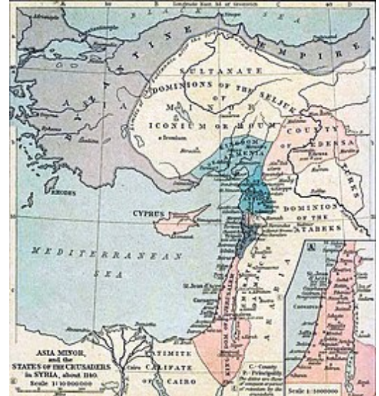
Kruisvaardersstaten in 1140

De Ridderorden hadden een belangrijke militaire positie in de kruisvaardersstaten. De Tempeliers en de Johannieters konden elk ongeveer 600 ridders in de strijd werpen, evenveel als de 1.200 ridders van het politiek bestuur. Ze gaven militair advies, namen deel aan diplomatieke missies en beheerden de kastelen. Vanaf 1150 hadden de politieke leiders het beheer van de kastelen overgedragen aan de ridderordes, omdat zij de enigen waren die over voldoende financiële middelen beschikten. Het overgrote deel van de kastelen in de Latijnse staten werd bemand door de ridderorden. Kastelen waren er van essentieel belang om het gering aantal westerse soldaten te compenseren. De ridderorden werden ook op de meest kwetsbare posities van een legercolonne geposteed. In de dertiende eeuw waren zij de enigen die zich nog interesseerden voor het platteland van Antiochië en Tripoli.