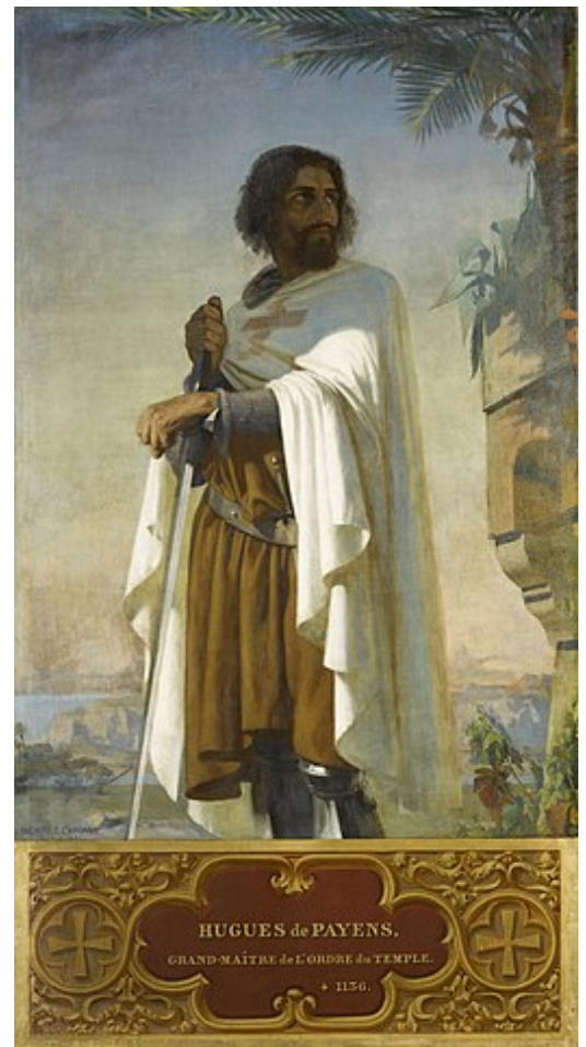
Hugues de Payns, eerste grootmeester van de Orde van de Tempeliers op een negentiende-eeuwse afbeelding