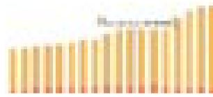
Klimaatbeleid: processie van Echternach ... maar dan...