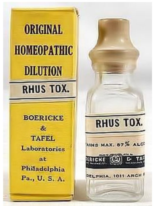
Homeopathisch middel Rhus toxicodendron , bereid uit gifsumak