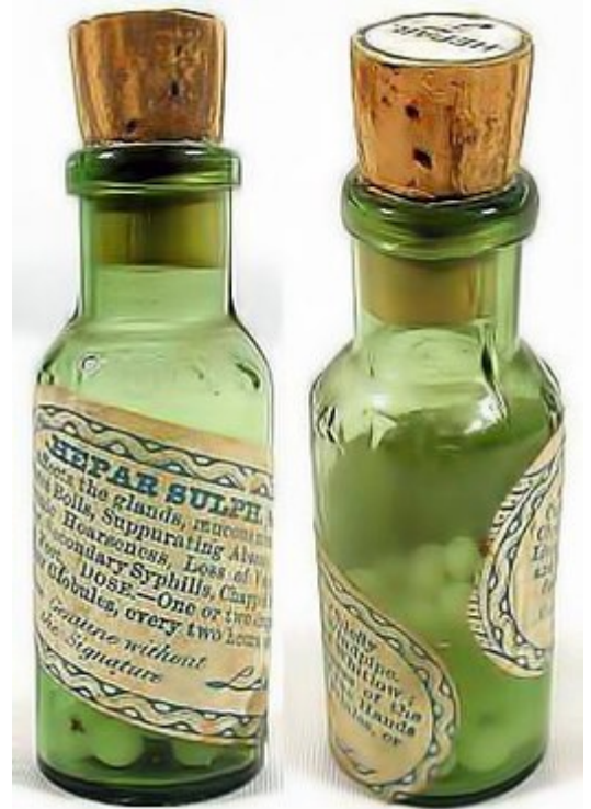
Oude fles Hepar sulph gemaakt uit calciumsulfide

Klinisch werkende homeopaten schrijven meestal voor op basis van de medische diagnose met slechts enkele individuele kenmerken van de patiënt. Er wordt dus met minder individuele kenmerken rekening gehouden dan in de klassieke homeopathie