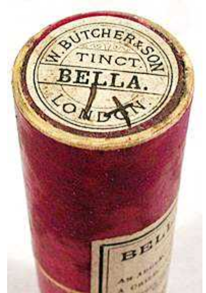
Oud homeopathisch middel bereid uit wolfskers.