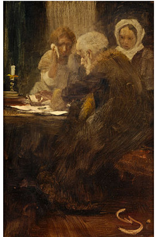
Bij de homeopaat Schilderij van Wilhelm Schreuer (1866–1933)

Alle lidstaten van de Europese Unie zijn verplicht homeopathische middelen te registreren, voor zowel het gebruik bij mensen als bij dieren. [noot 3] Voor de registratie van homeopathische middelen geldt binnen Europa een vereenvoudigde procedure die afwijkt van de registratie voor reguliere geneesmiddelen. In deze procedure hoeft de werkzaamheid of veiligheid van het middel niet aangetoond te worden. Wel moet de farmaceutische kwaliteit en de veiligheid van het middel beoordeeld worden voordat het product op de markt gezet mag worden. Deze procedure geldt enkel